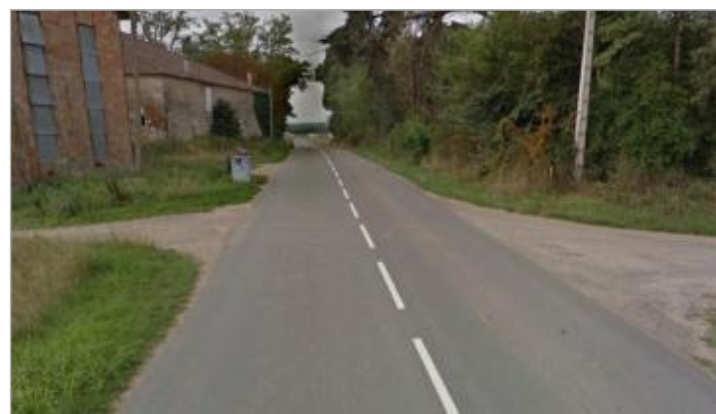
Débris végétaux sol

GÉNÉRAL Code : GTL_R_10355_1 Date de mise à jour : 18/11/2020 Auteur : SPC GTL