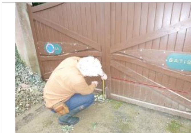
Trace de laisse portail

Altitude calculée de l'eau (en m) : 35.58