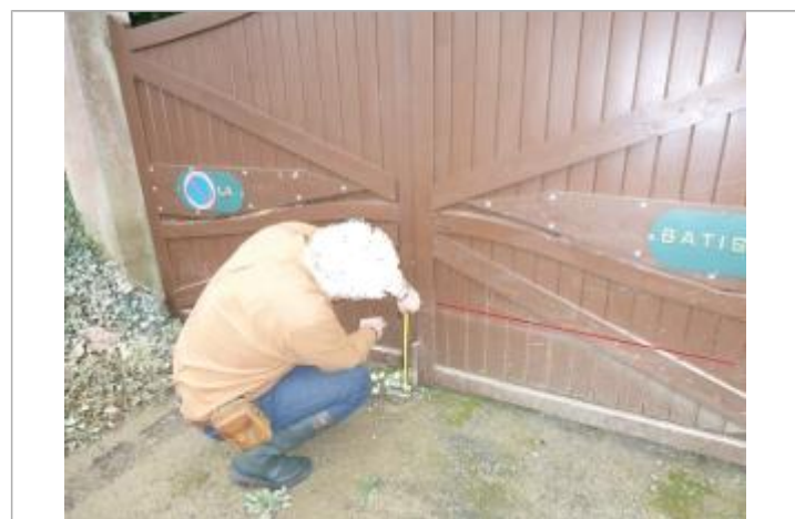
Trace de laisse portail

GÉNÉRAL Code : GTL_R_10350_1 Date de mise à jour : 13/11/2020 Auteur : SPC GTL