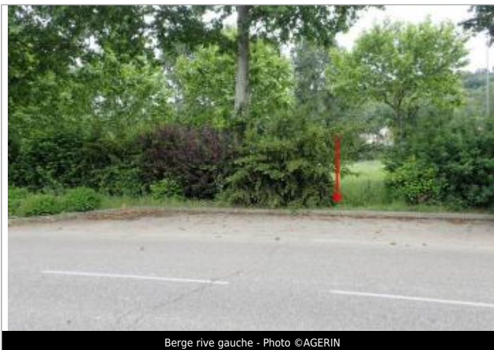
Berge rive gauche