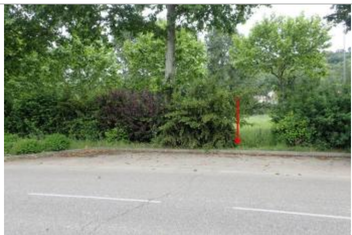
Trace de laisse mur

Altitude calculée de l'eau (en m) : 35.74