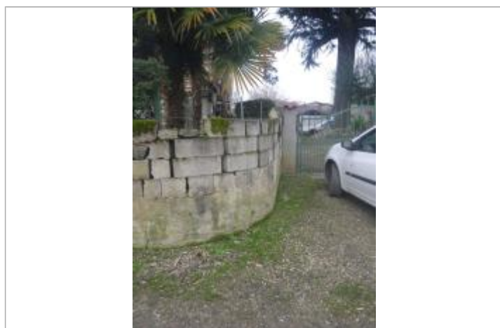
Trace de laisse muret

Code : GTL_R_10341_1 Date de mise à jour : 12/11/2020 Auteur : SPC GTL