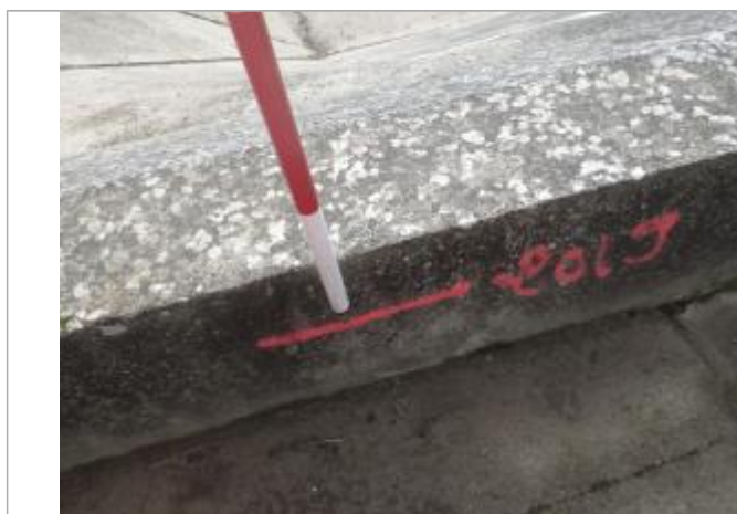
Trace de laisse digue