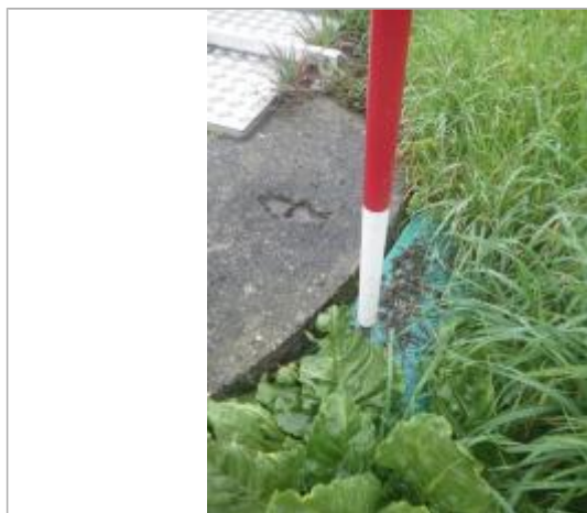
Débris végétaux dalle