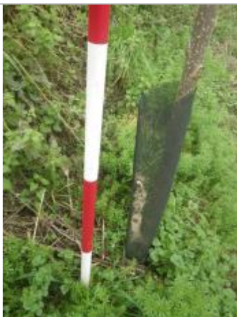
Débris végétaux sol