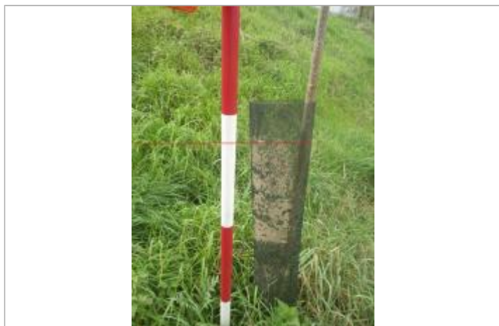
Débris végétaux grille

Altitude calculée de l'eau (en m) : 38.49