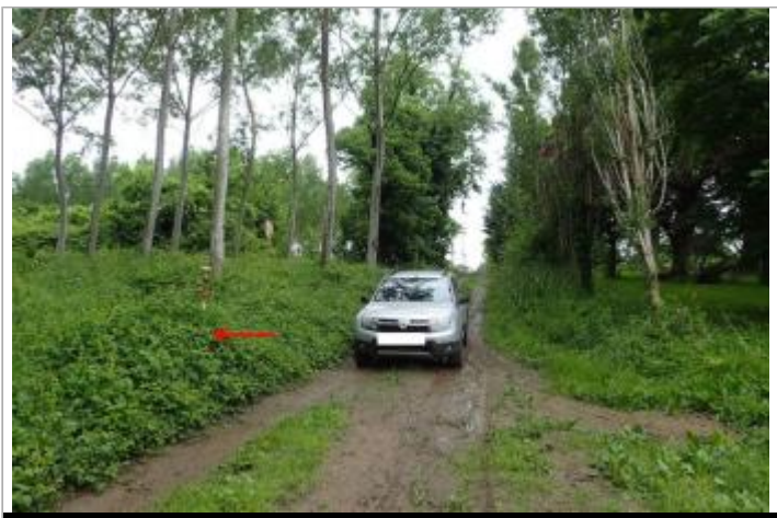
Peupleraie chemin de la Caton

GÉOLOCALISATION Coordonnées WGS84 : X: 0.80977459 / Y: 44.12617470 Coordonnées RGF93 (Lambert 93) X: 524741.69 / Y: 6338782.97 Coordonnées RGF93 (ETRS89) : X: 0.8097746 / Y: 44.1261747 Code Hydro: O---0000 Rive de référence: Droite