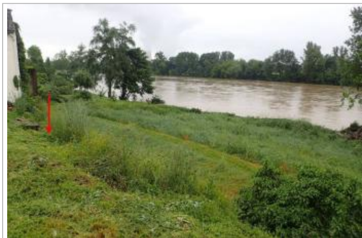
Berge rive droite proche rue Pasteur

GÉOLOCALISATION Coordonnées WGS84 : X: 0.81497189 / Y: 44.12488930 Coordonnées RGF93 (Lambert 93) X: 525153.51 / Y: 6338628.69 Coordonnées RGF93 (ETRS89) : X: 0.8149719 / Y: 44.1248893 Code Hydro: O--0000 Rive de référence: Droite