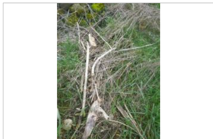
Débris végétaux au sol

GÉNÉRAL Code : GTL_R_10296_1 Date de mise à jour : 20/11/2020 Auteur : SPC GTL