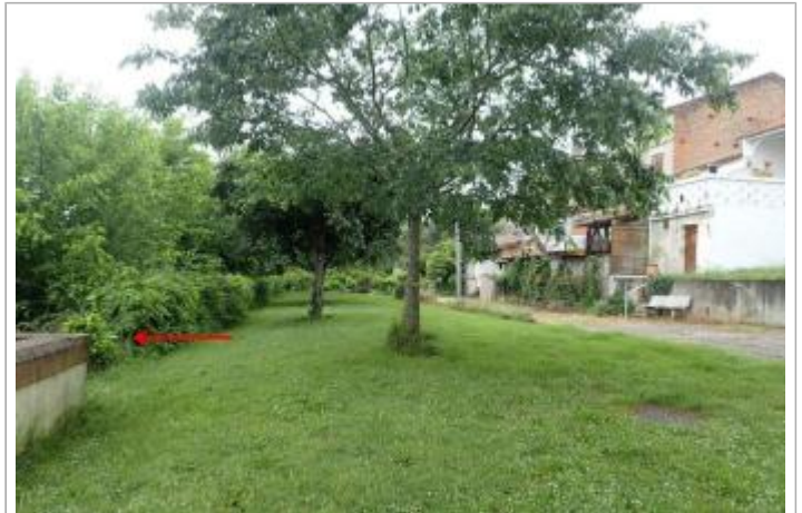
Berge rive droite quai Chauderon

Coordonnées WGS84 : X: 0.81735600 / Y: 44.12441070