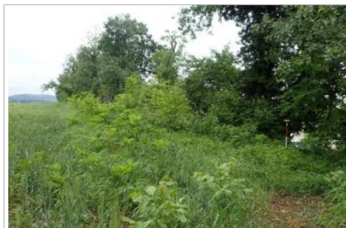
Champs entre la Séoune et la Garonne

GÉOLOCALISATION Coordonnées WGS84 : X: 0.67636591 / Y: 44.16286740 Coordonnées RGF93 (Lambert 93) X: 514189.48 / Y: 6343163.01 Coordonnées RGF93 (ETRS89) : X: 0.6763659 / Y: 44.1628674 Code Hydro: O---0000 Rive de référence: Droite