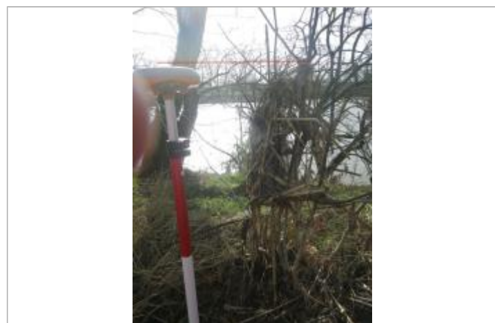
Débris végétaux berge de la Garonne

GÉNÉRAL Code : GTL_R_10291_1 Date de mise à jour : 21/11/2020 Auteur : SPC GTL