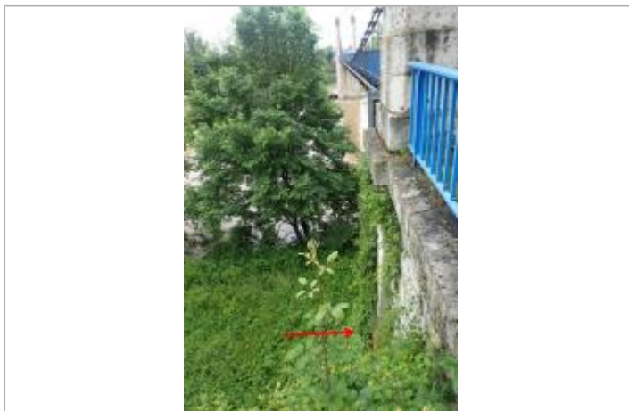
Pile rive droite du pont D308