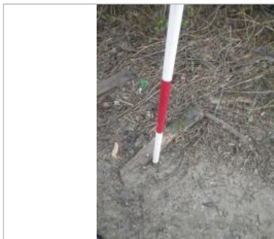
Débris végétaux sol