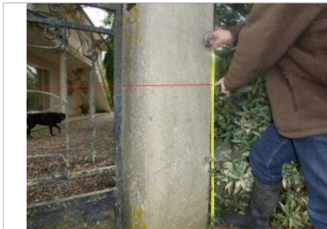
Trace muret portail