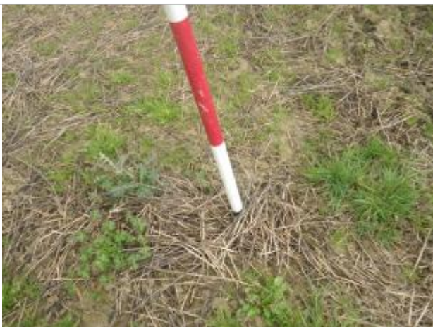
Débris végétaux sol

Altitude calculée de l'eau (en m) : 31.78