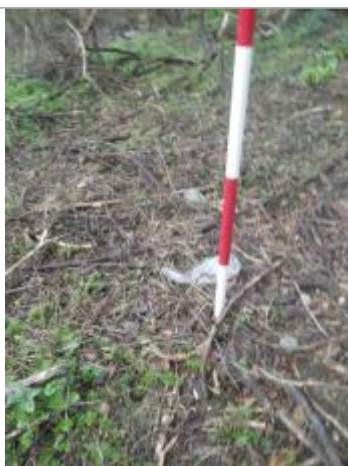
Débris végétaux sol