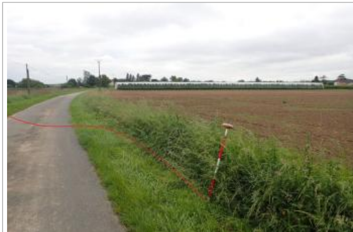
Berge quai rive droite