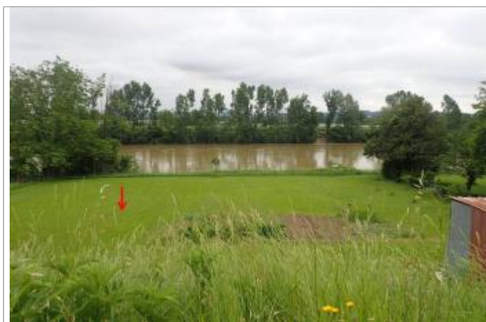
32 Lapouleille Ouest

GÉOLOCALISATION Coordonnées WGS84 : X: 0.48096417 / Y: 44.23970960 Coordonnées RGF93 (Lambert 93) X: 498841.49 / Y: 6352174.98 Coordonnées RGF93 (ETRS89) : X: 0.4809642 / Y: 44.2397096 Code Hydro: O---0000 Rive de référence: Droite