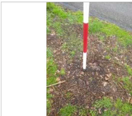
Débris végétaux sol