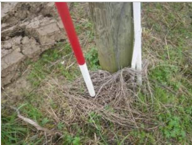
Débris végétaux sur poteau téléphonique