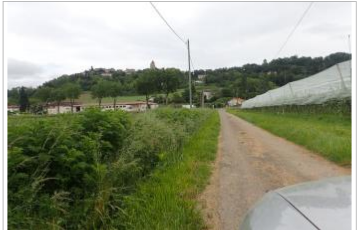
Poteau téléphonique Laserre - Photo ©AGERIN