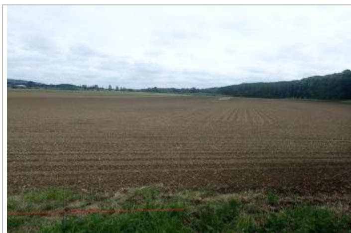
Berge rive gauche Baïse

GÉOLOCALISATION Coordonnées WGS84 : X: 0.28926268 / Y: 44.27035780 Coordonnées RGF93 (Lambert 93) X: 483655.76 / Y: 6356084.84 Coordonnées RGF93 (ETRS89) : X: 0.2892627 / Y: 44.2703578 Code Hydro: O6--0290 Rive de référence: Gauche