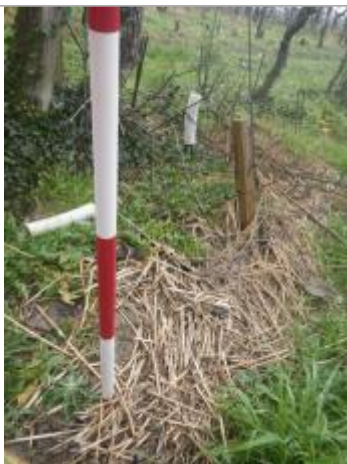
Débris végétaux sol