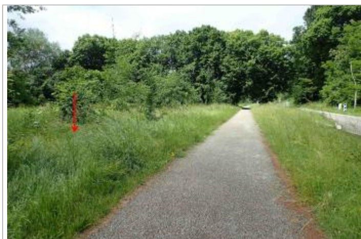
piste cyclable

GÉOLOCALISATION Coordonnées WGS84 : X: 0.61769262 / Y: 44.16813410 Coordonnées RGF93 (Lambert 93) X: 509516.7 / Y: 6343887.69 Coordonnées RGF93 (ETRS89) : X: 0.6176926 / Y: 44.1681341 Code Hydro: O--0000 Rive de référence: Droite