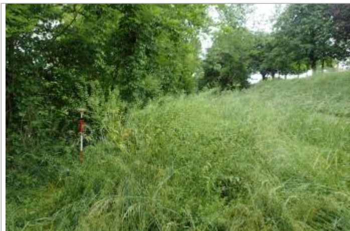
Piste cyclable à Boé