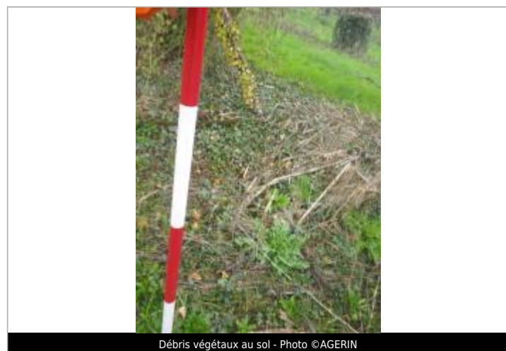
Débris végétaux au sol