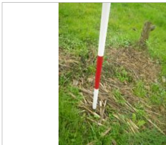
Débris végétaux sol