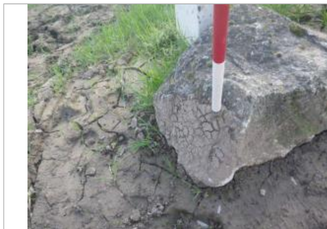
Trace de laisse sol

Altitude calculée de l'eau (en m) : 31.56