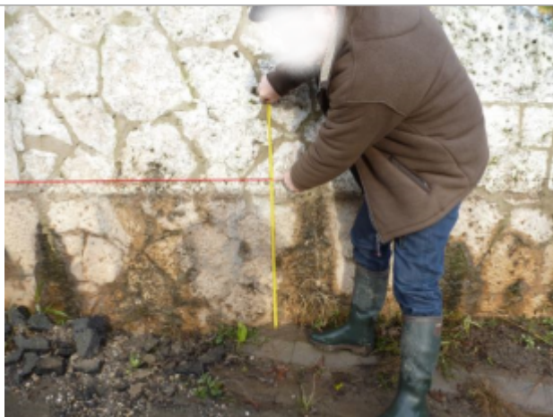
Laisse d'inondation sur le mur

Altitude calculée de l'eau (en m) : 32.02