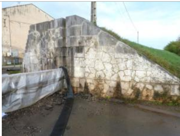
Av. de Lattre de Tassigny