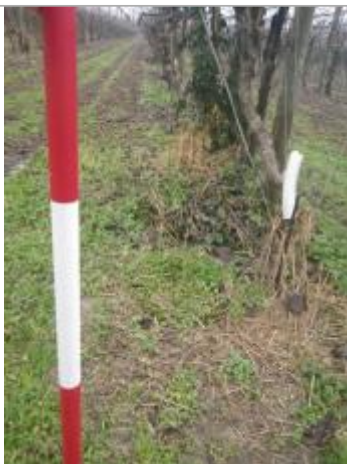
Débris végétaux dans Vergers