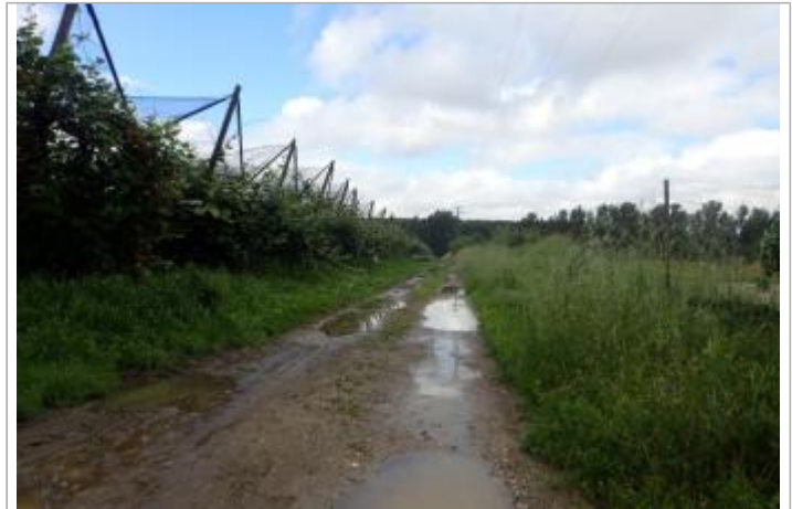
Vergers Goux

Coordonnées WGS84 : X: 0.56076437 / Y: 44.21853710