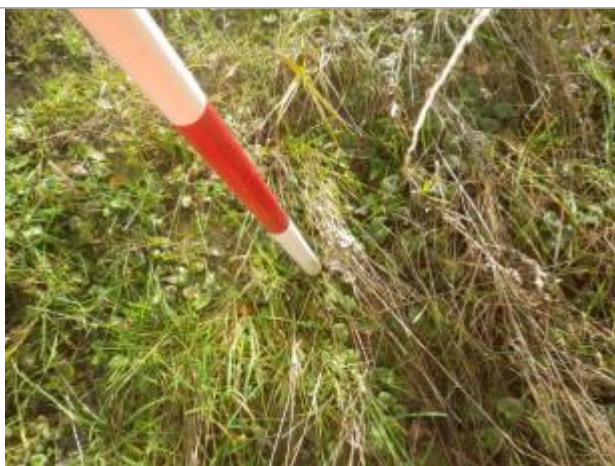
Débris végétaux sur sol

Altitude calculée de l'eau (en m) : 43.84