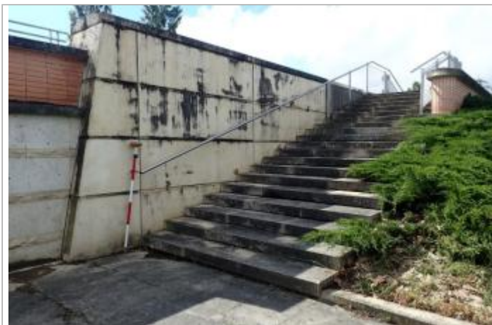
Escalier rive gauche