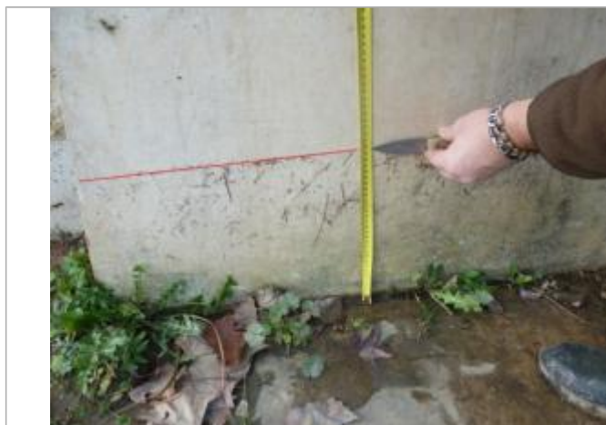
Laisse d'inondation sur le mur

Altitude calculée de l'eau (en m) : 43.45