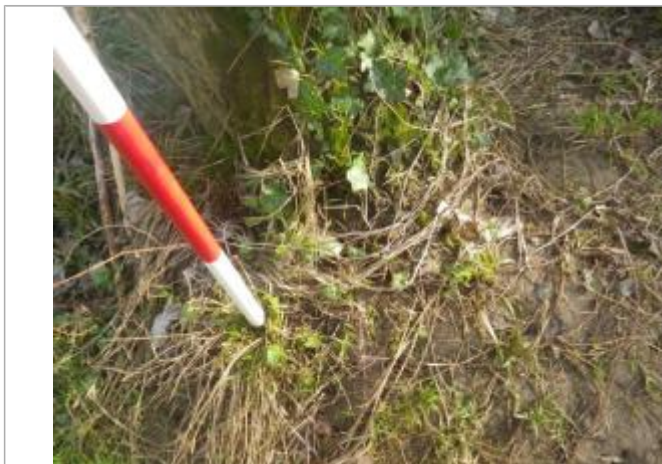
Débris végétaux sur sol