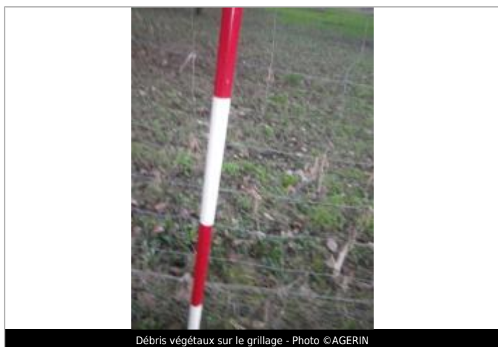
Débris végétaux sur le grillage - Photo ©AGERIN

Code : GTL_R_10204_1 Date de mise à jour : 12/11/2020 Auteur : SPC GTL