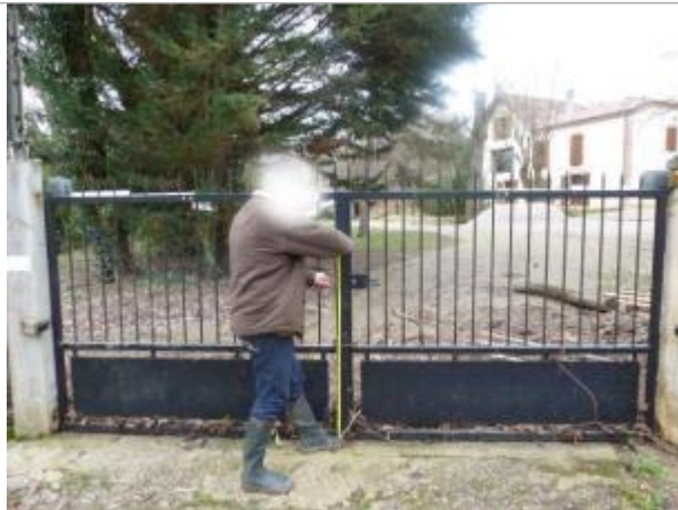
Le Passage