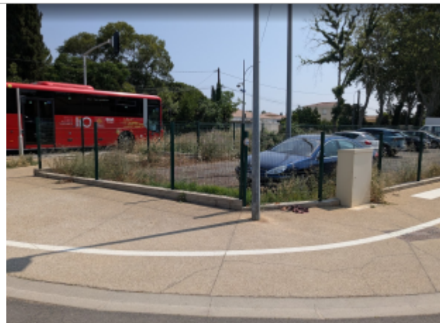
chemin st michel 2

Coordonnées WGS84 : X: 3.27345992 / Y: 43.32084880