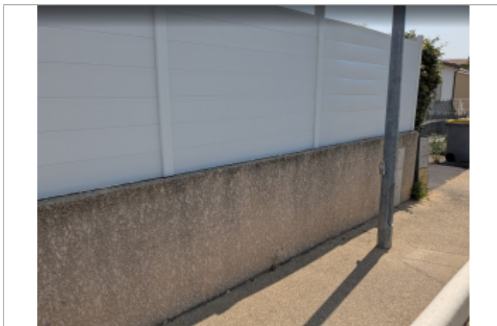
chemin st michel