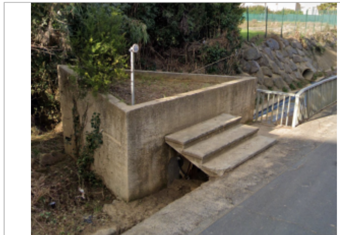
av puissalicon lieuran

Coordonnées WGS84 : X: 3.23744233 / Y: 43.42030930