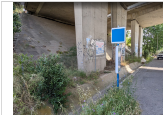
pilier pont A9

Coordonnées RGF93 (ETRS89) : X: 3.2682076 / Y: 43.3226057