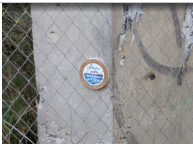
pilier pont A9