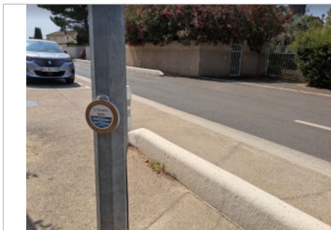
chemin st michel