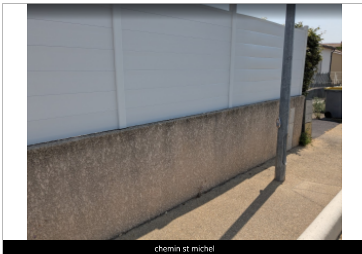
chemin st michel