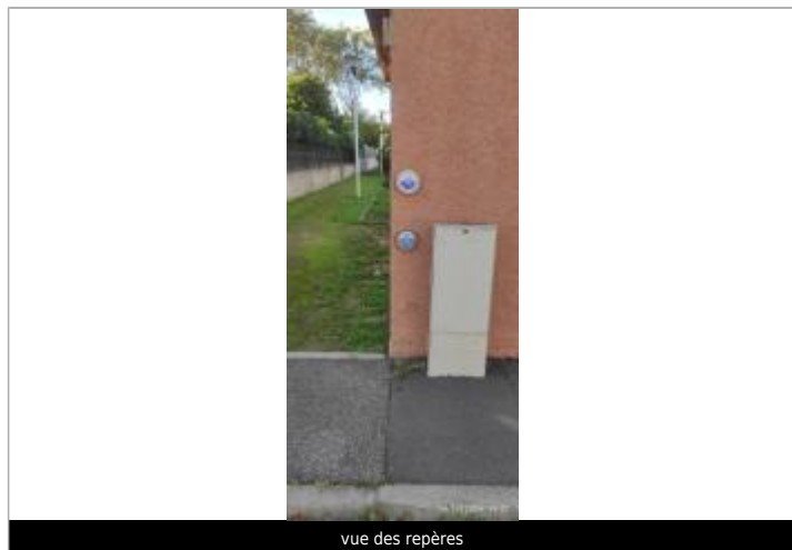
vue des repères

Altitude calculée de l'eau (en m) : 5.48