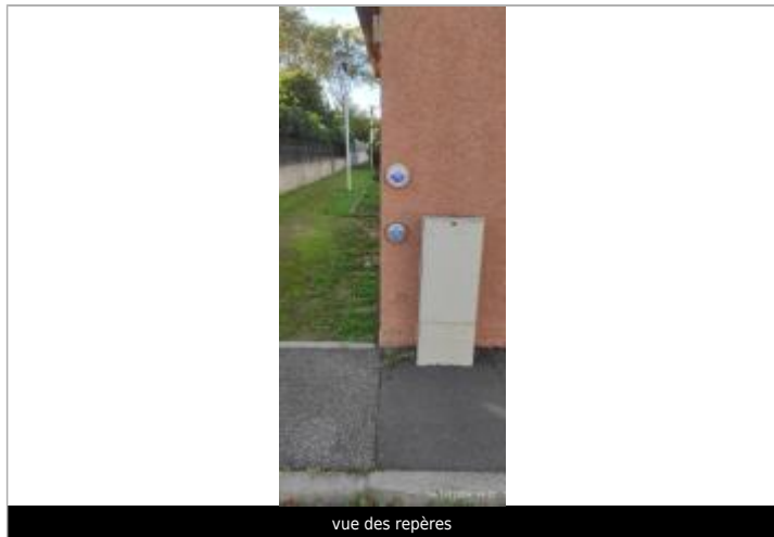
vue des repères

Altitude calculée de l'eau (en m) : 5.48