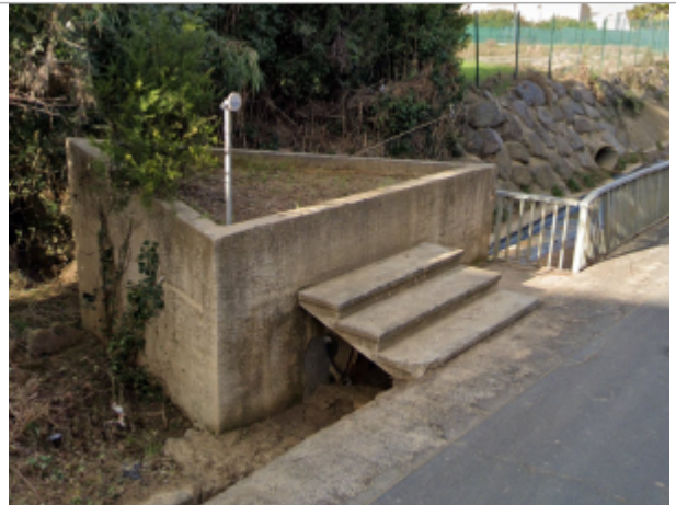
av puissalicon lieuran

Coordonnées WGS84 : X: 3.23744233 / Y: 43.42030930