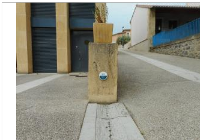
repère devant école