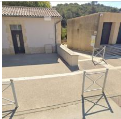
Vue du site, repère situé face à l'école au fond de la petite rue