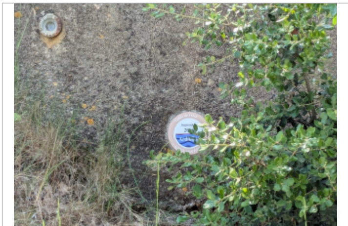
chemin de vias portiragnes