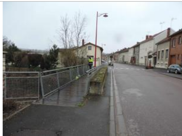
Pont rue Saint-Lazare en direction de Vitry-en-Perthois