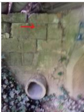
Marque sous la passerelle du pont aval RD

Altitude calculée de l'eau (en m) : 98.59 m