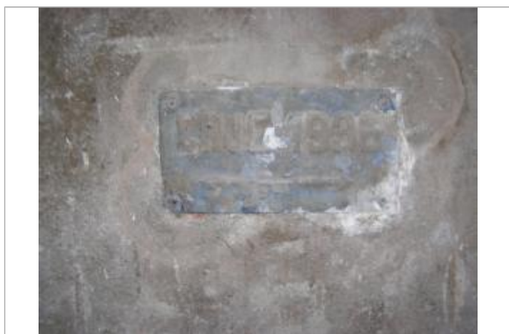
Repère 1936 Manufacture

Code : WEB_R_202010144627 Date de mise à jour : 17/02/2022 Auteur : Julien Lamberti - Nantes Métropole