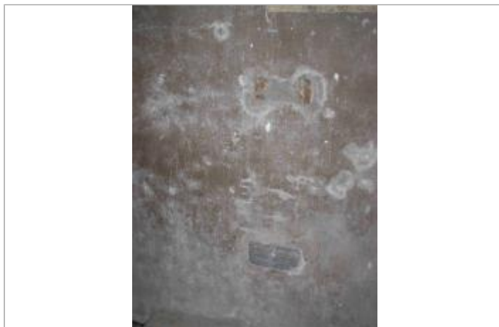
Sous-sol de la Manufacture