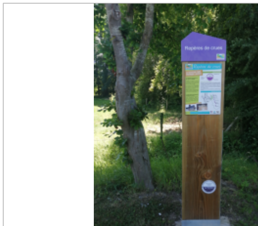
Le totem du repère de crue d'Hermanville

Altitude calculée de l'eau (en m) : 38.77 m