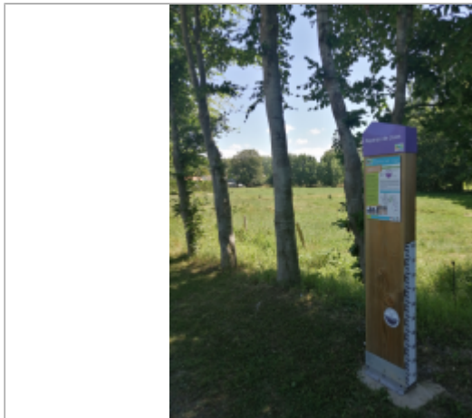
Entre le pont et l'église sur le côté de la RD 108