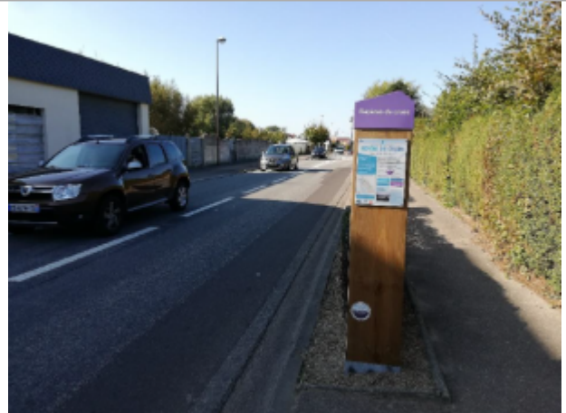
Photo du totem du repère de crue installé en août 2017

Coordonnées WGS84 : X: 1.10485530 / Y: 49.91095600