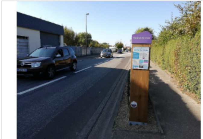
Photo du totem du repère de crue installé en août 2017