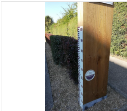
Laisse de crue à 49 cm/sol. Photo du totem de repère de crue installé en août 2017