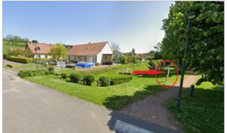
Vue depuis la rue de la résidence "des Saules".

Coordonnées WGS84 : X: 1.13091260 / Y: 49.89998100