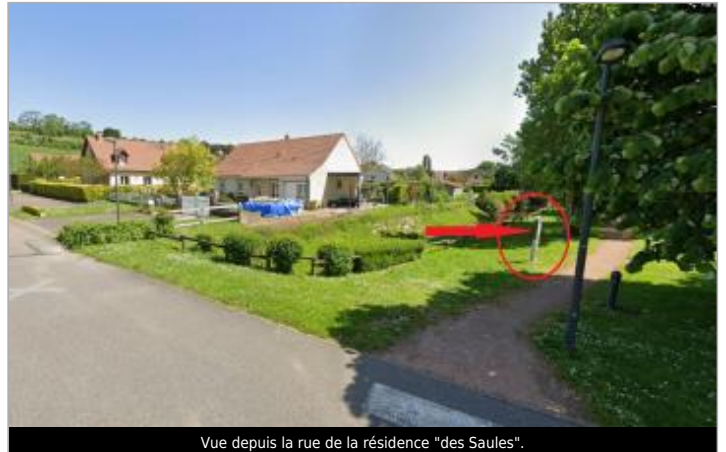
Vue depuis la rue de la résidence "des Saules".