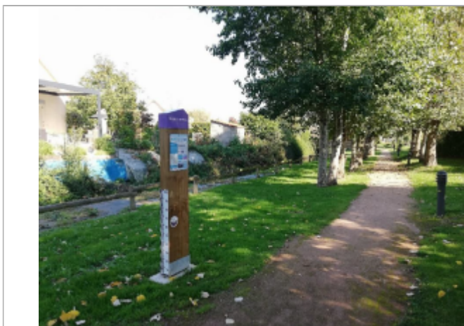
Photo du totem de repère de crue à 62 cm/sol, installé en août 2017