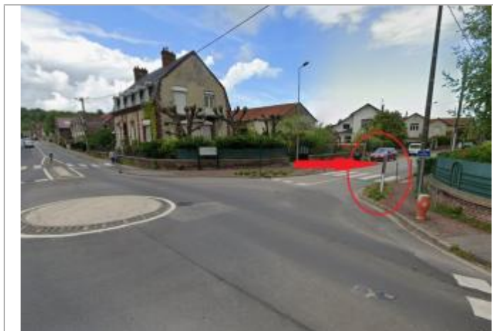
Vue depuis le Rond-Point