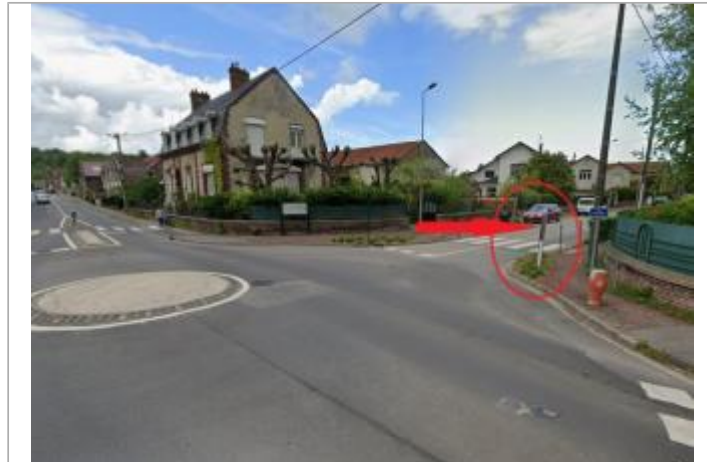
Vue depuis le Rond-Point

Coordonnées WGS84 : X: 1.13614400 / Y: 49.88122900