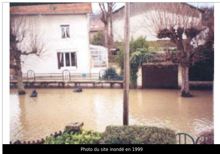
Photo du site inondé en 1999