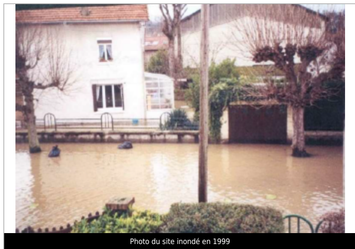
Photo du site inondé en 1999