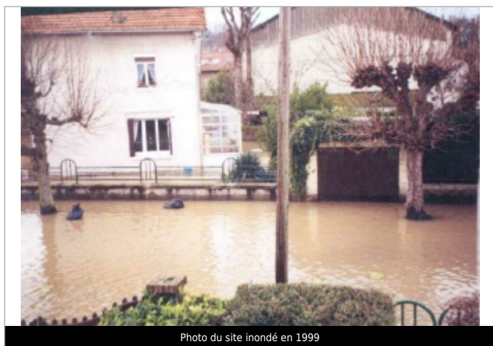
Photo du site inondé en 1999