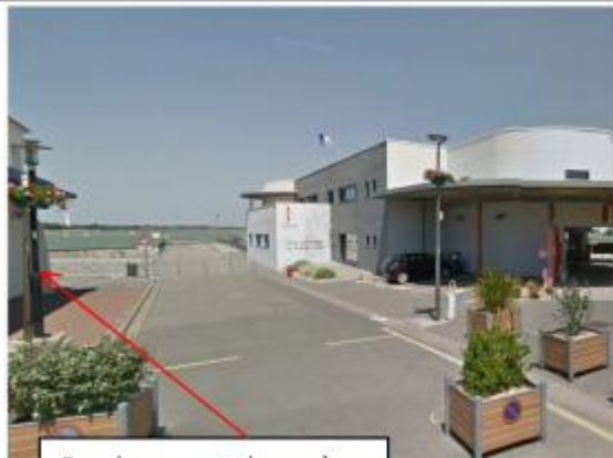
Emplacement du repère