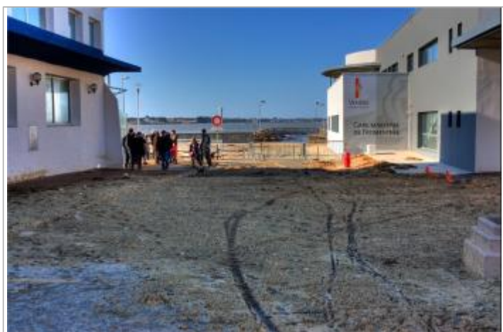
28 Février 2010

Méthode : GPS Référence nivelée : Marque d'inondation Système altimétrique : NGF IGN 1969 (système normal) Altitude de la référence (en m) : 4.690 m Altitude calculée de l'eau (en m) : 4.69